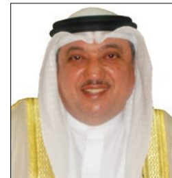
سعادة البروفيسور يوسف عبدالغفار رئيس مجلس إدارة الشبكة الإقليمية للمسؤولية الاجتماعية رئيس الهيئة الاستشارية