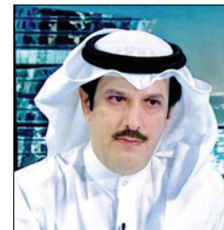
سعادة المستشار بدر محسن المطيري الاكاديمي والخبير في مجال الاعلام والمسؤولية المجتمعية والتنمية المستدامة