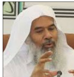
سعادة الشيخ أحمد الصبان وكيل وزارة الشؤون الإسلامية «سابقا» - المملكة العربية السعودية