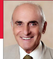
معالي السيد منيب المصري رئيس مؤسسة منيب المصري للتنمية عضو مؤسس للبنك الإسلامي الفلسطيني والبنك الوطني في فلسطين