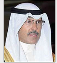
معالي الشيخ فواز بن خالد الصباح محافظ محافظة الأحمدية بدولة الكويت