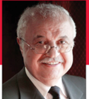
سعادة الدكتور طلال أبو غزالة رئيس مجلس إدارة مجموعة طلال أبوغزالة السفير الدولي للمسؤولية المجتمعية