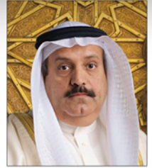
الرعاي الفخري للمؤتمر سعادة السيد

أ. عدنان أحمد يوسف الرئيس التنفيذي لمجموعة البركة المصرفية السفير الدولي للمسؤولية المجتمعية